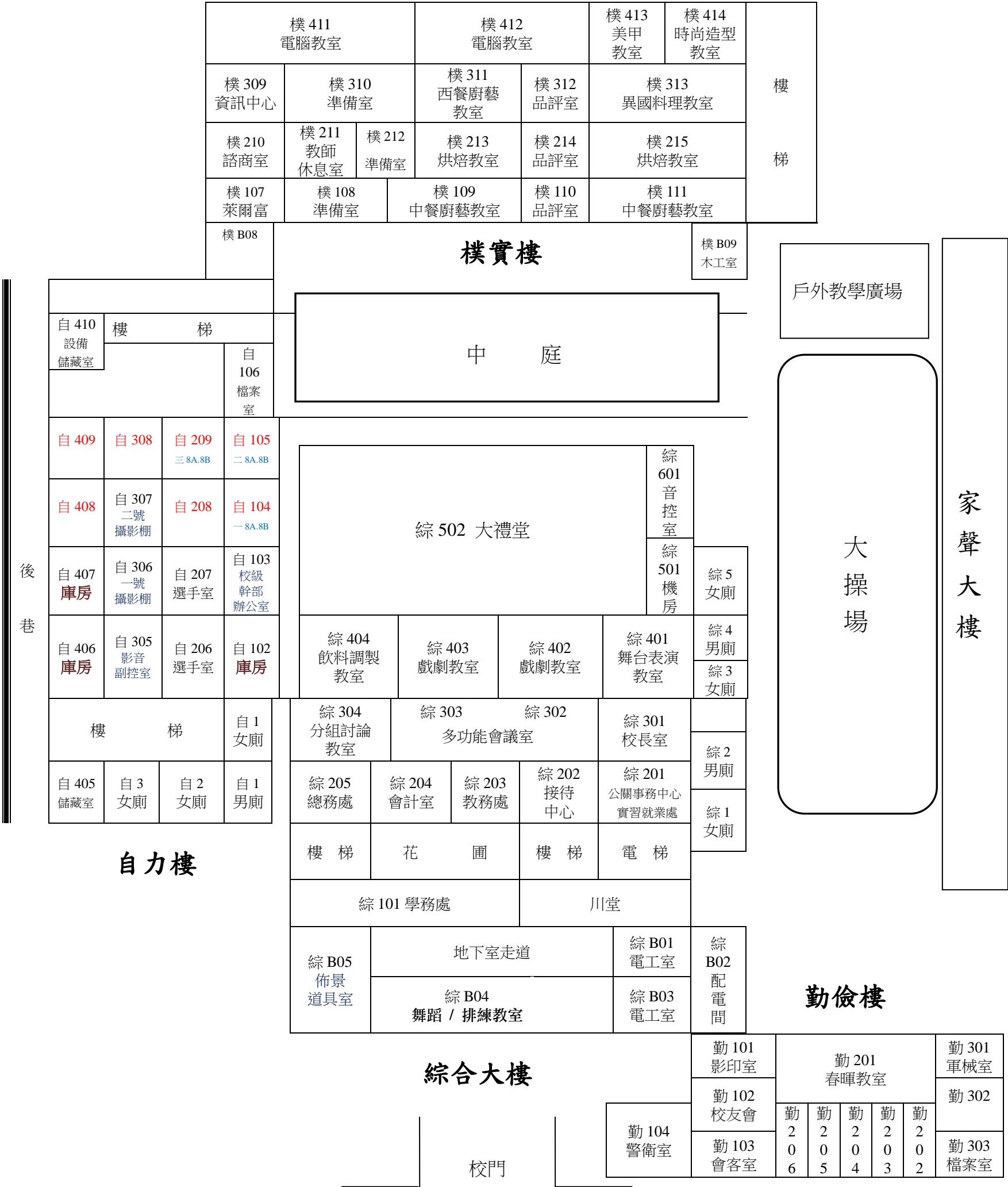
普林思頓高中 校 園 平 面 簡 圖（111 學年度第 1 學期 111 年 8 月 30 日）